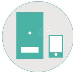
Nya digitala lås