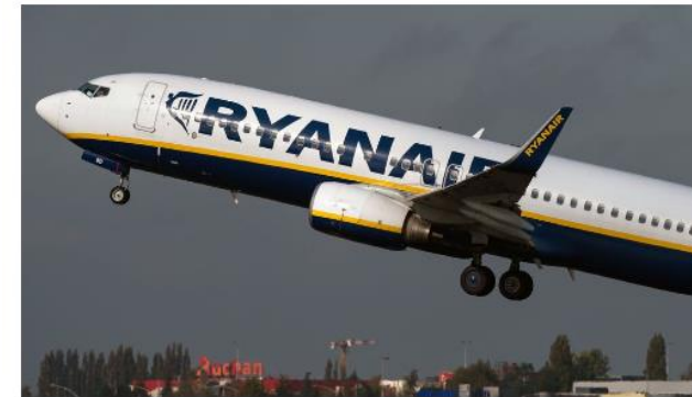
Anställda vid Ryanair i Danmark har nu rätt till kollektivavtal, slår en dom fast.

Anställda vid lågprisflygbolaget Ryanair i Danmark har nu laglig rätt att kräva kollektivavtal och att bli företrädna av en fackförening. Det slås fast i en dom från landets arbetsrättsdomstol. Ryanair har överklagat till Europadomstolen – men Pilotföreningen i Sverige tror att domen också kan få betydelse för anställda här.