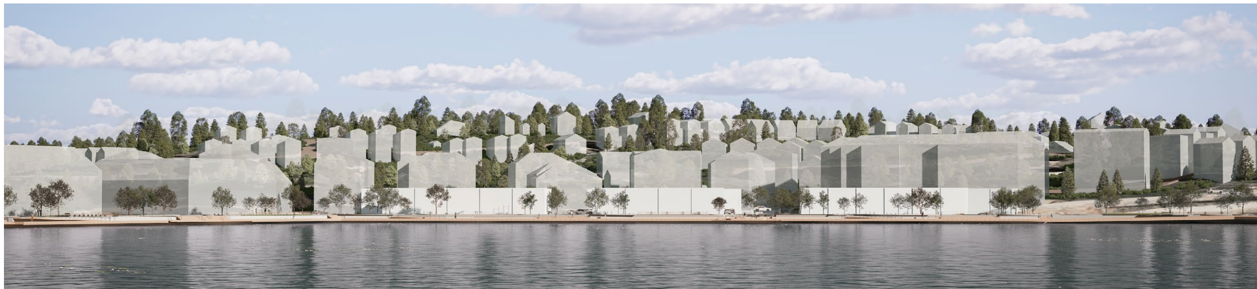
Fig. 13: Visionsbild över Sjöterrassen sedd söderifrån