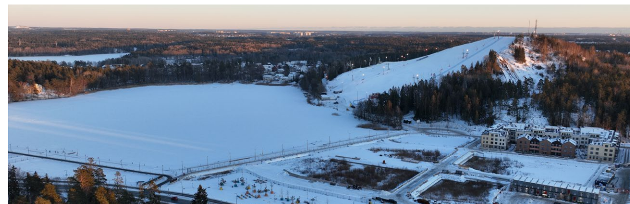
Fig. 5: Väsjöbacken sedd från nordväst (januari 2026)