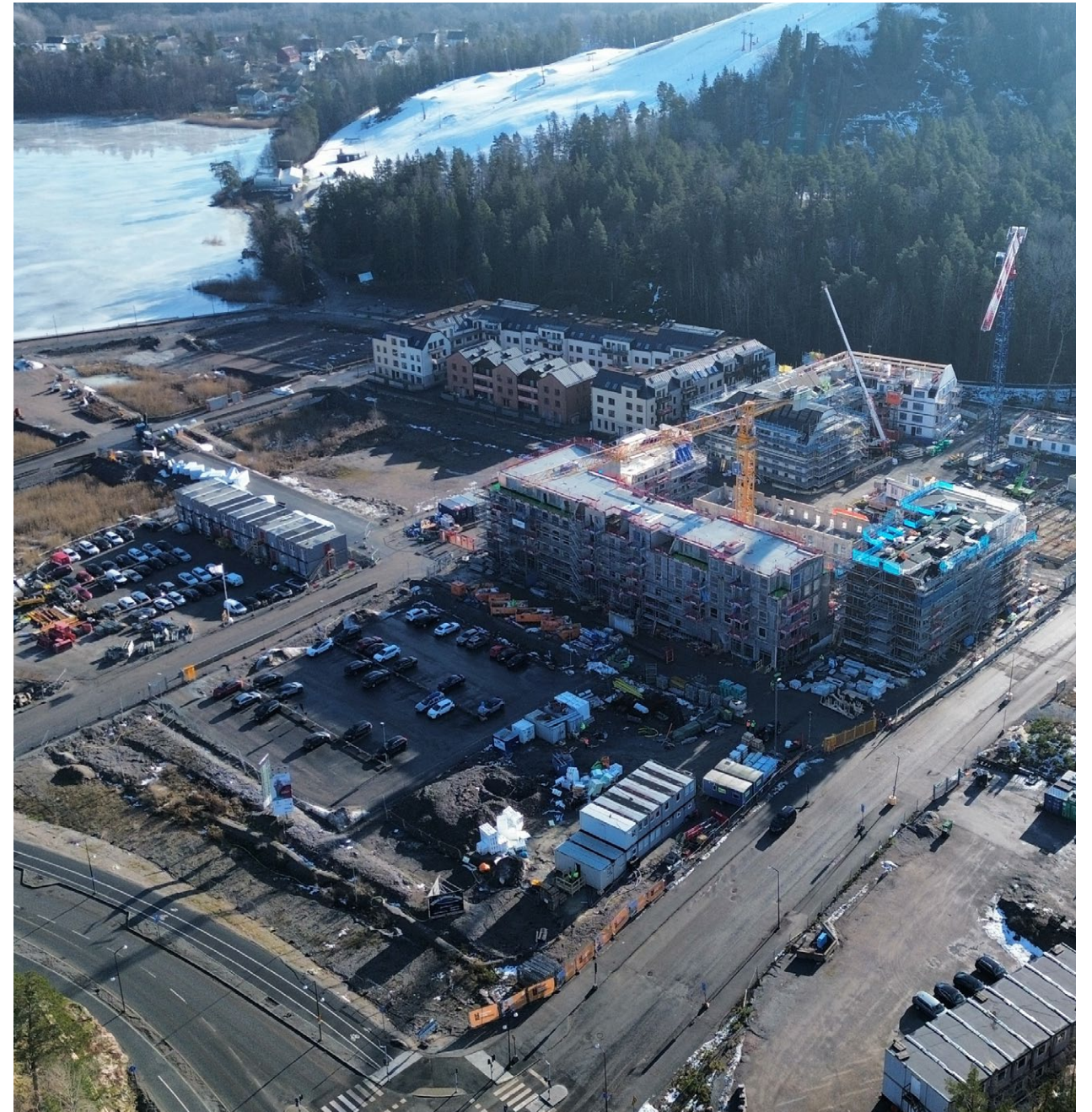
Fig. 9: Pågående utbyggnad på Väsjo torg, sett från nordväst (mars 2026)

Liksom den allmänna platsen ska även kvartersmarken utformas med hög kvalitet för att bidra till att uppnå visionen för Väsjön och svara upp mot kommunens ambitioner för en välgestaltad stadsutveckling. Under 2015 togs det fram ett kvalitetsprogram för gestaltning som visar hur visionen ska uppnås. Kvalitetsprogrammet utgör ett grundläggande styrdokument för samtliga markförsäljningar och ska följas av intressenten, se bilaga 4 till tävlingsinbjudan. För mer information om vilka gestaltungsprinciper som anses som särskilt viktiga se rubrik Konceptförslag i denna tävlingsinbjudan.