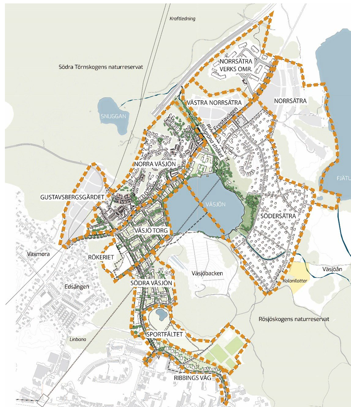
Fig. 2: Väsjöns delområden

Profilen bygger på de egenskaper som redan finns i och kring Väsjön – som Väsjöbacken, de två naturreservaten, sjön och Edsbergs sportfält – och som nu utvecklas vidare. Genom arkitektur präglad av småskalighet och variation skapas naturliga möten mellan natur och stad, egen tid och sociala sammanhang.