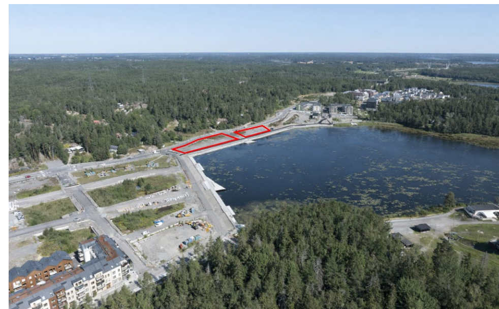
Fig. 10: Aktuell lott sedd från sydväst. Observera att markeringen är ungefärlig

Frestavägen i norr har utformats med gång- och cykelbana direkt intill fastighetsgränsen, parkeringsfickor och ska kompletteras med stadsmässig grönska. Väsjö kajen i söder, som angränsar till den aktuella lotten, utformas med gång- och cykelbana direkt intill fastighetsgränsen och som ett kajstråk med parkkaraktär längs Väsjöns strand. Kajstråket syftar till att främja både rörelse och vistelse, med goda möjligheter till rekreation, samt innehålla inslag av utomhusgym, bänkar, grönska och kajer. Den del av kajstråket som angränsar till lotten är orienterad mot sjön i sydostläge.