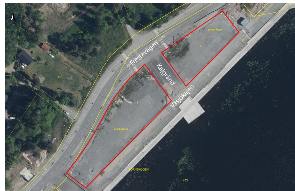
Fig. 11: Sjöterrassen inom röd linjemarkering med intilliggande gator