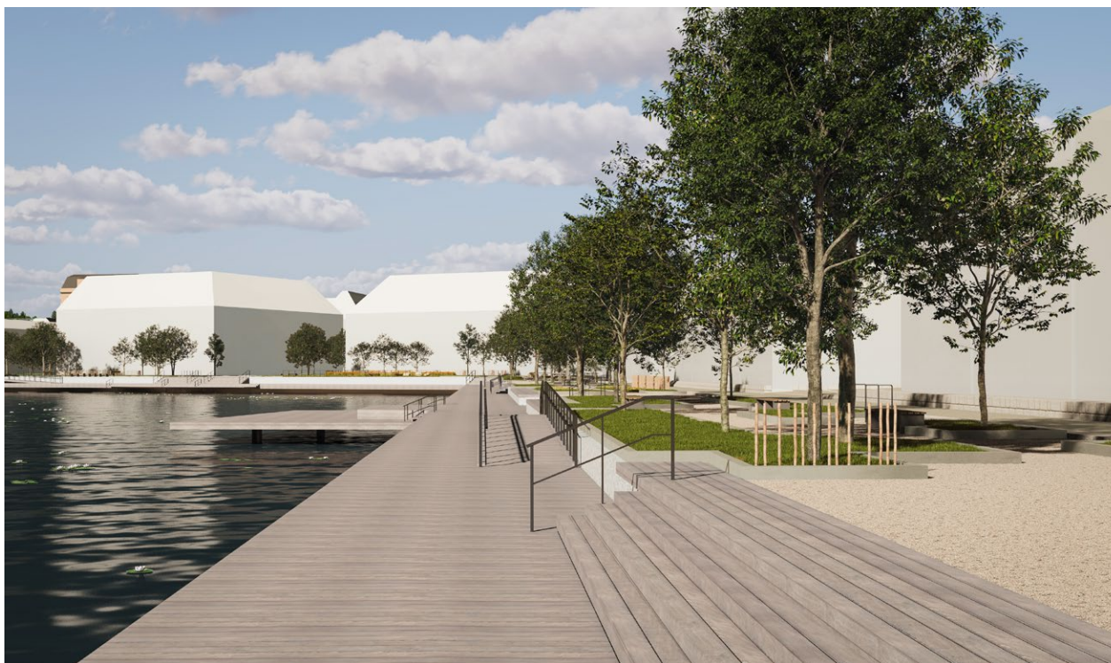
Fig. 12: Visionsbild över Väsjökajen från nordost

Sjöterrassen ska utformas så att kajstråkets funktion och kvaliteter förstärks, och så att bebyggelsen bidrar till ett aktivt, tryggt och attraktivt möte med den allmänna platsen.