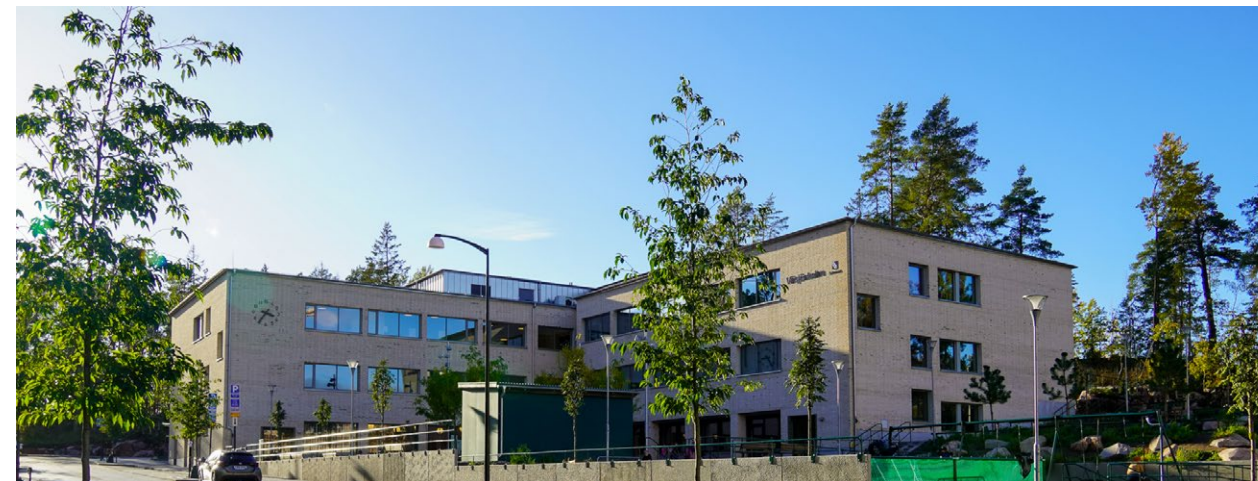
Fig. 4: Väsjöskolan står färdig sedan augusti 2025

Inom delområdet Södersätra, på andra sidan sjön, färdigställdes friluftsförskolan Väsjön 2024. Förskolan rymmer 140 barn och drivs i privat regi av Tellusbarn i Sverige AB.