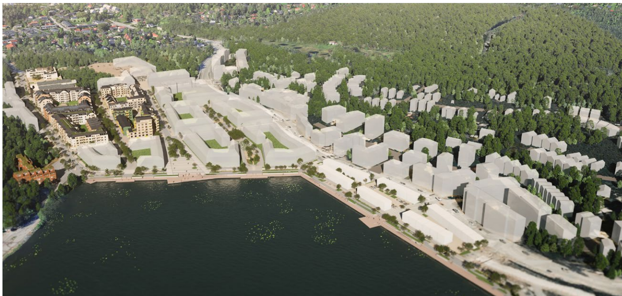
Fig. 3: Visionsbild över "Sjöterrassen" och dess omgivning