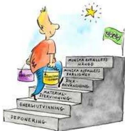
Figur 1: Avfallstrappan 5

Avfallshantering är en viktig del inom resurshantering/konsumtion där kommunen genom samarbetet med övriga kommuner inom SÖRAB har en avfallsplan. Avfallsplanen utgår från avfallstrappan. Avfallsplanen har uttalade mål och delmål. Både Sollentuna energi och miljö AB och Miljö- och byggnadskontoret arbetar aktivt med att nå målen