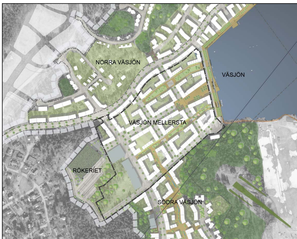
Planområdets läge i Väsjön

Aktuell ändring av detaljplan omfattar endast del av detaljplan för Väsjön Mellersta. Ändringen omfattar inte Frestavägen eller bebyggelsen utefter Frestavägen och ej heller kvartersmarken närmast Väsjöbacken. Motivet till avgränsningen av planområdet är att endast inkludera de områden där behov av ändring enligt detaljplanens syfte föreligger. Del av kvartersmarken som gränsar mot Väsjöbacken omfattas inte av aktuell ändring. Motivet till avgränsningen är att linbanan mellan Södersåtra och Häggvik planeras i denna del och att det i dagsläget är oklart om det eventuellt behövs en ny detaljplan för att möjliggöra linbanans dragning i denna del.