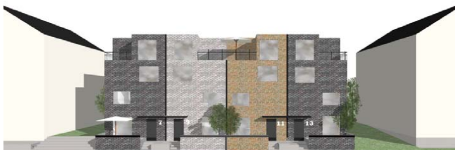
Illustration till bestämmelse p 2 om bebyggelsefria släpp. Illustrationen visar flera bebyggelsefria släpp med en sammanlagd bredd på minst 15 meter. Garageplan som utförs som upphöjd gård är inte beräkningsgrundande i enlighet med bilden.

Bebyggelsen utefter gångfartsgatorna ska placeras så att ett eller flera bebyggelsefria släpp skapas mot förgårdsmarken. De bebyggelsefria släppen ska tillsammans ha en sammanlagd bredd på minst 15 meter. Syftet med bestämmelsen är att skapa öppningar mot gångfartsgatorna som släpper in ljus och som bildar kopplingar mellan allmän plats och kvartersmark och som skapar variation i upplevelsen av bebyggelsen. Garageplan som anordnas som upphöjd, eller delvis upphöjd, gård är inte beräkningsgrundande, se illustration nedan.