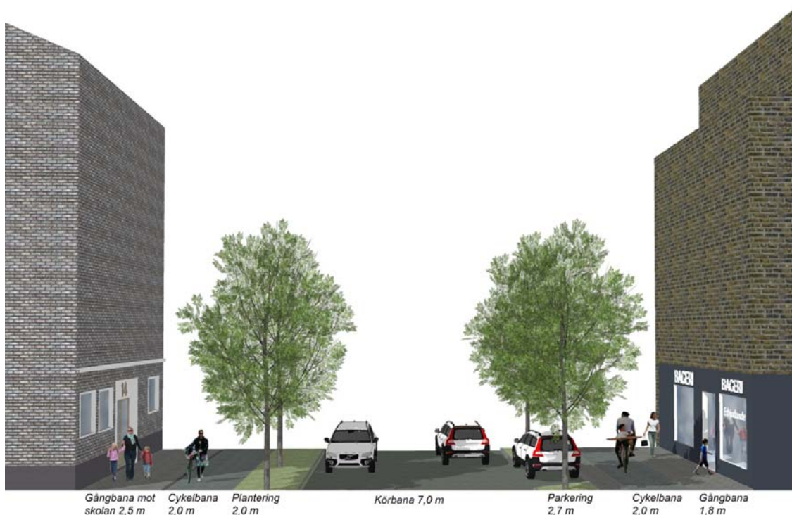
Normalsektion över Edsbergs allé

För att Edsbergs allé ska få en sektion som möjliggör för cykelstråk med hög standard i enlighet med kommunens cykelplan, avses gatan att breddas med 2 meter åt väster. Ändringen innebär att en remsa som är planlagd för skola respektive bostäder övergår och regleras som huvudgata. Utfartsförbudens läge mot gatan förändras inte.