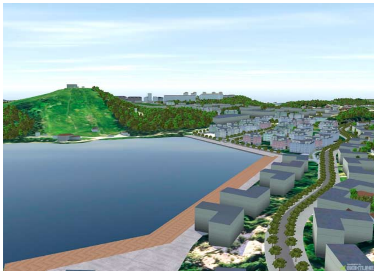
Delar av den nya bebyggelsen i Väsjön - en modern sjöstad

Mer information finns att läsa på kommunens webbplats www.sollentuna.se under rubriken Bygga och bo/Aktuella detaljplaner/Väsjöområdet .