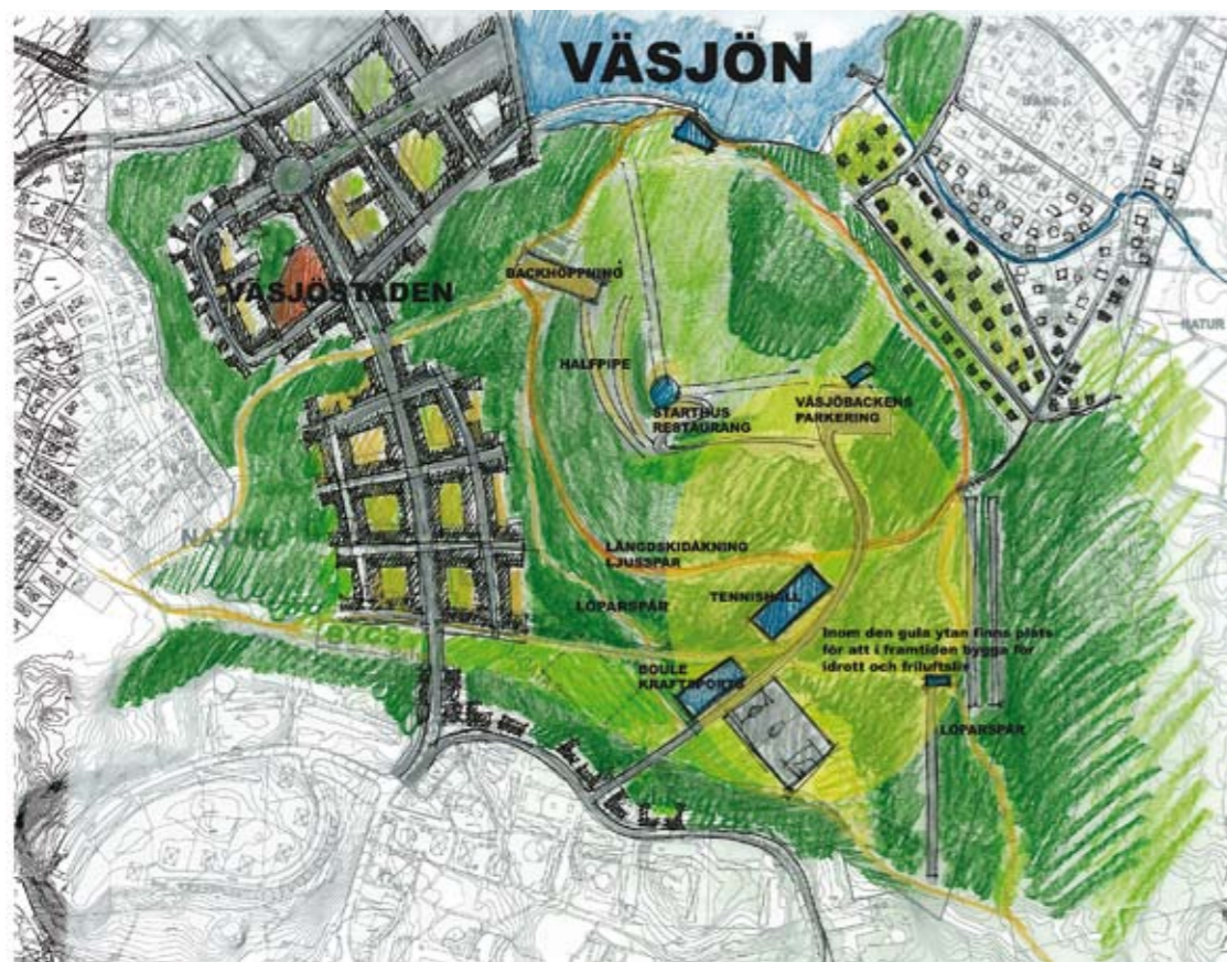
Skiss som visar hur nuvarande idrottsverksamhet kan placeras och utvecklas när Väsjästaden byggs.

Området kring Väsjöbacken ska i planeringen av Väsjästaden reserveras för fritids- och idrottsverksamhet, med tanke också på framtiden. Den öppna karaktären i den delen av dalgången som idag rymmer konstgräsplaner, grusfotbollsplaner mm. ska bibehållas. De framtida behoven är svåra att sätta om i dagsläget, och planerna ska lämna öppet för andra verksamheter, till exempel ett idrottsgymnasium eller för- och grundskolor med uttalad friluftsinriktning.