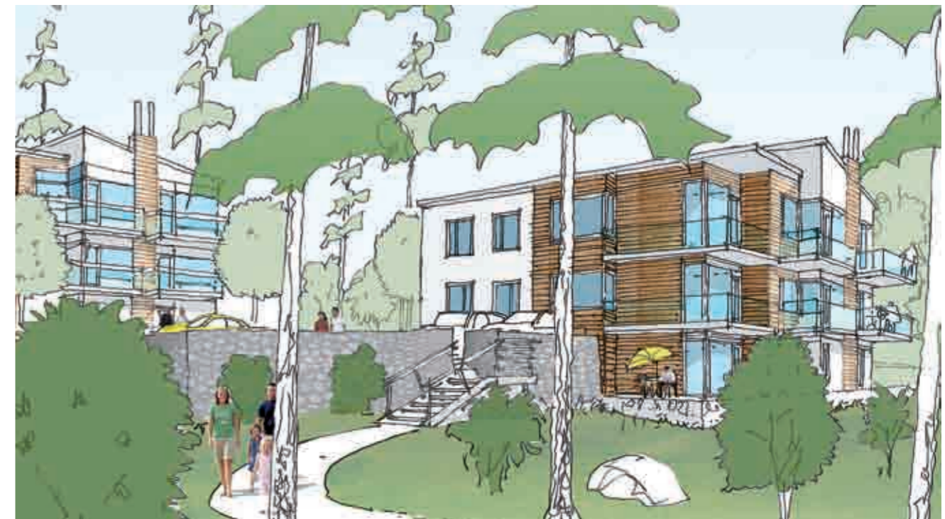
Veidekkes stadsvillor vid Kastellgården, sedda från söder.

Med förgårdsmark, öppningar i sidan samt följsamhet mot topografin utgör kvarteret en övergångsform från det mer slutna stadsmässiga kvartersstaden till villastadens öppna struktur. Gården bjuder på inblickar och utblickar men förblir ändå en trygg plats där man kan vara och delta i livet omkring kvarteret. Flanörer kan uppleva gårdsrummet som likt en amfiteater klättrar uppåt mot nordost. Husens utformning med variation och mänsklig skala ansluter till samtida villabebyggelse och har ett yttre som kommunicerar med platsen och sin omgivning.