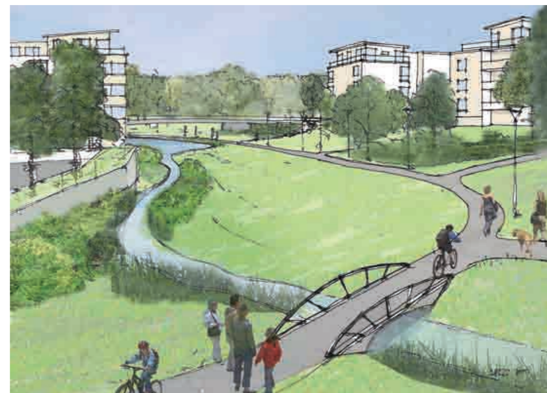
Snuggabäckens blågröna stråk. Illustration: Bjerking.