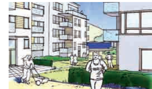
Riksbyggen planerar att bygga cirka 70 bostäder vid det blågröna stråket.

– I Väsjöområdet är förutsättningarna sällsynt goda för att skapa en bra boendemiljö. Jag tänker mig det som en ”friluftstad” där man vill gå ut och befolka omgivningarna och det händer något utan att det behöver kosta en massa pengar. Livet finns även utanför bostaden och det som behövs är initiativ, säger han.