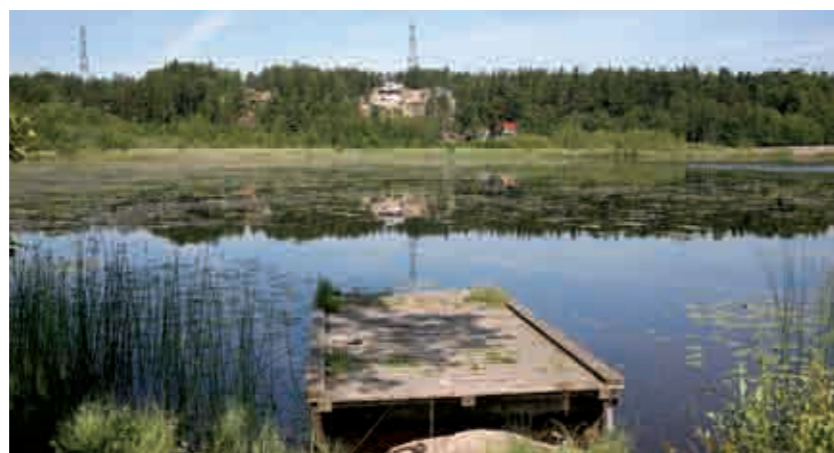
Restaureringen av Väsjön kan starta när övrig bebyggelse har kommit en bit på väg och nya dagvattenanläggningar är i drift.

– Väsjön är grund och näringsrik och därmed en naturligt igenväxande sjö. De insatser vi planerar att göra leder till att näringstillförseln minskar. Genom att höja vattenkvaliteten kan vi undvika algbloomingar och skapa en tillgänglig fågelsjö där