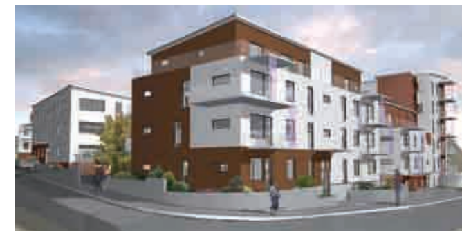
NCC planerar att bygga fem bostadshus norr om Väsjön.